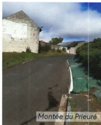
Montée du Prieuré