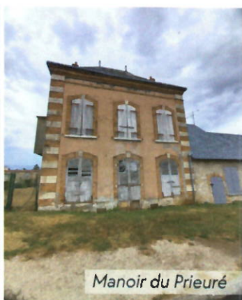
Manoir du Prieuré