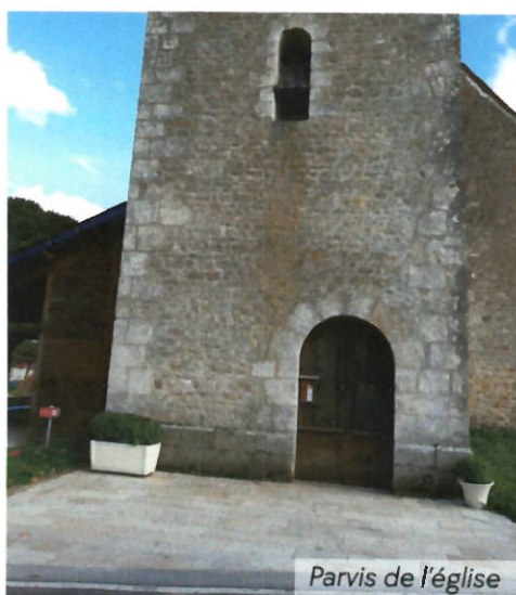
Parvis de l'église