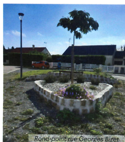
Rond-point rue Georges Bizet