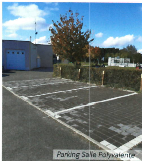
Parking Salle Polyvalente

En 2024, la commune de Dadonville a investi environ 280 000 €.